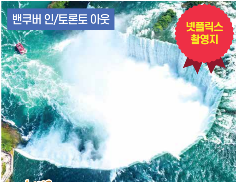
밴쿠버 인/토론토 아웃